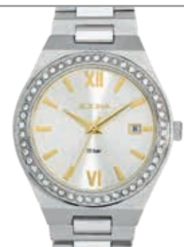
AT5493 Edelstahl, Ø 36 mm, 10 bar wasserdicht, Damenuhr UVP 119,-