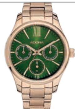
AT5467 Edelstahl ionenplattiert, Ø 34 mm, 5 bar wasserdicht UVP 129,-