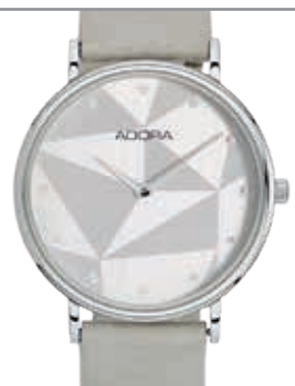
AT5501 Edelstahlgehäuse mit Lederband Ø 38 mm, 3 bar wasserdicht UVP 79,90