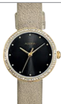
AT5509 Ionenplattiertes Edelstahlgehäuse mit Lederband, Ø 26 mm, 3 bar wasserdicht UVP 99,-