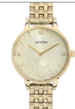
AT5469 Edelstahl ionenplattiert, Ø 30 mm, 3 bar wasserdicht UVP 99,-