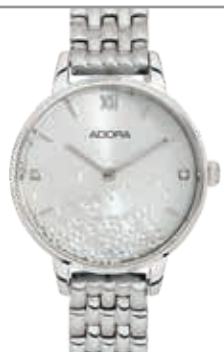
AT5471 Edelstahl, Ø 30 mm, 3 bar wasserdicht UVP 89,90