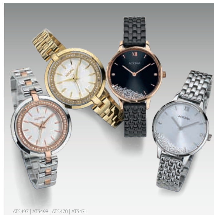
AT5497 | AT5498 | AT5470 | AT5471

Ob klassisch, elegant, oder extravagant – unter der langjährig bewährten Fachhandelsmarke ADORA verbirgt sich im halbjährlichen Wechsel ein vielseitiges Portfolio mit interessanten und absatzstarken Armbanduhren in gefälliger Preisklasse.