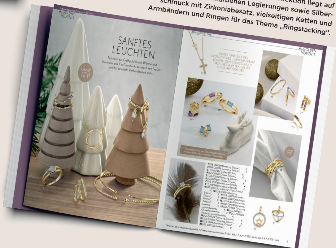
Der Fokus bei der Herbst/Winter-Kollektion liegt auf Gold und goldfarbenen Legierungen sowie Silberschmuck mit Zirkonabesatz, vielseitigen Ketten und Armbändern und Ringen für das Thema „Ringstacking“.

gesamt sind 19 Außendienstmitarbeiter und -mitarbeiterinnen deutschlandweit mit den myTrends-Kollektionen unterwegs. Die Kunden können aus drei Varianten wählen: Als Katalog für Schmuck auf acht oder 16 Seiten oder als Katalog für Uhren und Schmuck auf 16 Seiten mit Streugewichten von 13,2 und 26,4g. Den Katalog können sich Juweliere vielseitig individualisieren lassen: Etwa mit Logo auf Titel und Rückseite, einem Firmenportrait und individuellen Empfehlungen mit Portraitbild sowie mit einem individuellen