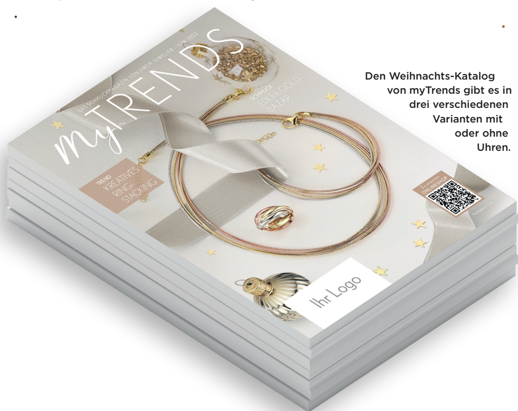
Den Weihnachts-Katalog von myTrends gibt es in drei verschiedenen Varianten mit oder ohne Uhren.

Der myTrends-Katalog bietet nicht nur passenden Schmuck für die Saison, sondern unterstützt mit Marketing-Maßnahmen über Social Media auch optimal das Online-Geschäft.